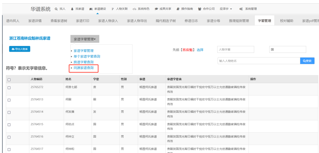
图 15. 进入同源家谱查询页面

(1) 如图 15, 在【字辈管理】页面中, 点击【家谱字辈管理】下拉框并选择【同源家谱查询】, 进入到字辈管理模块中的同源家谱查询页面: