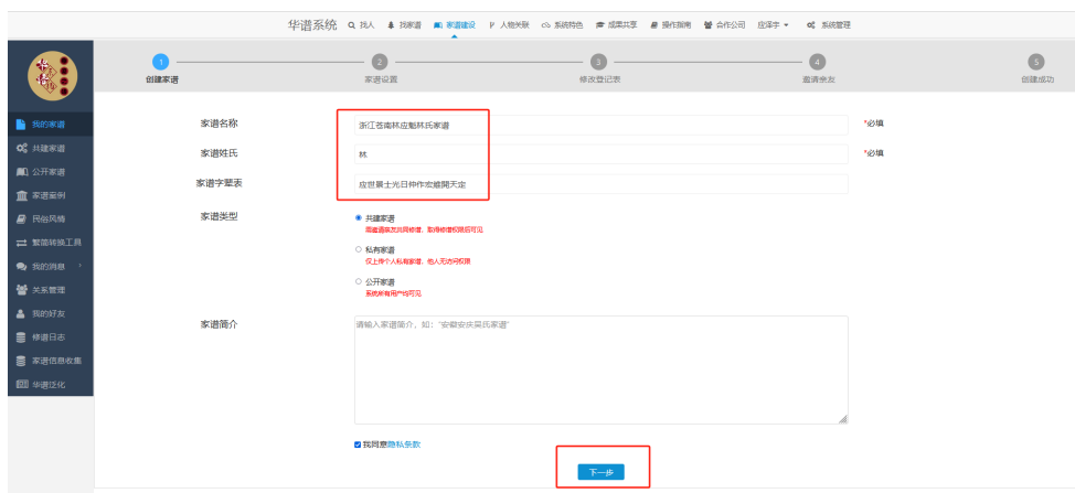
图 5. 填写家谱信息页面

(2) 如图 5，进入【新建家谱】页面后，填写【家谱名称】、【家谱姓氏】和【家谱字辈表】并点击【下一步】按钮直至家谱创建成功。家谱创建成功后，字辈表也生成成功：