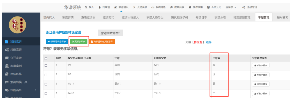
图 8. 更新字辈表

(3) 如图 8，进入【字辈管理】页面后，点击【更新字辈表】按钮；【更新字辈表】按钮会根据下方表格的字辈表列按照代数生成字辈表：