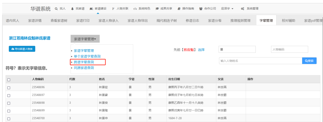
图 13. 进入跨谱字辈查询页面

(1) 如图 13，在【字辈管理】页面中，点击【家谱字辈管理】下拉框并选择【跨谱字辈查询】，进入到字辈管理模块中的跨谱字辈查询页面：