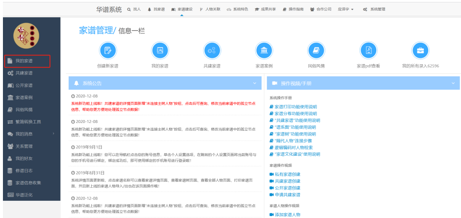
图 3. 我的家谱模块