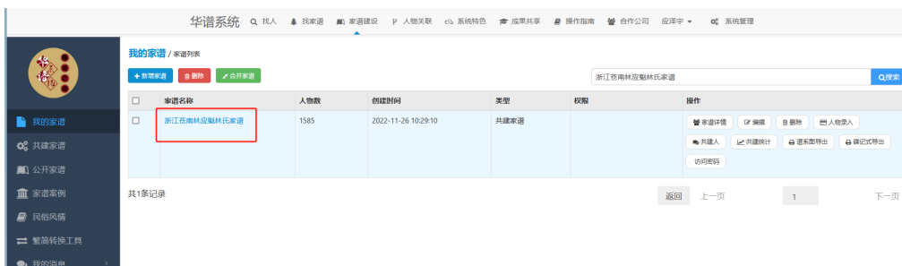
图 6. 我的家谱页面

(1) 如图 6，进入【我的家谱】页面后，点击【家谱名称】跳转至【谱内找人】页面：