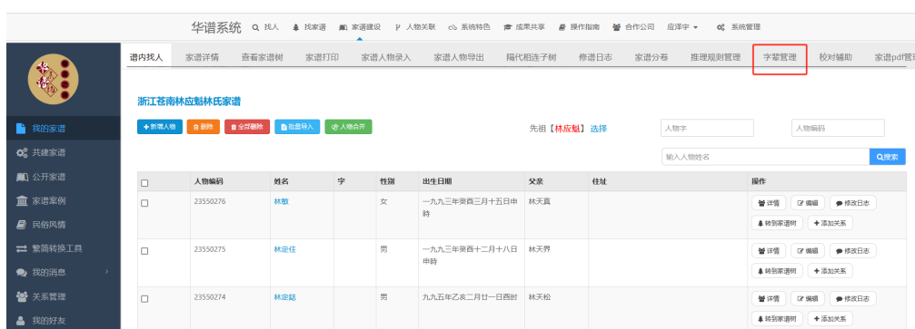
图 7. 字辈管理页面

(2) 如图 7，进入【谱内找人】页面后，点击【字辈管理】跳转至【字辈管理】页面：