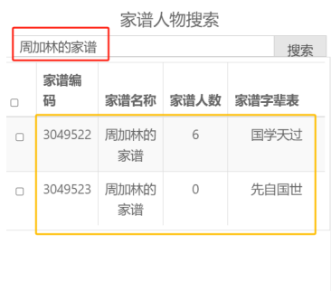
图 16. 选择系统其他家谱页面

(2) 如图 16, 在【同源家谱查询】页面中, 点击【选择待同源对比家谱】按钮选择系统中其他家谱: