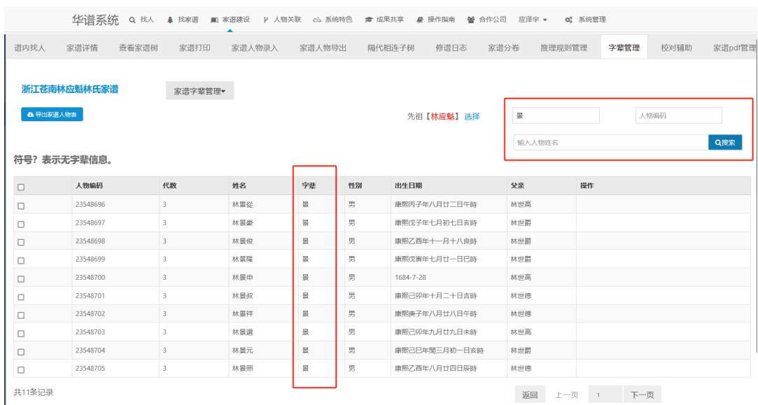
图 12. 单个家谱字辈查询页面