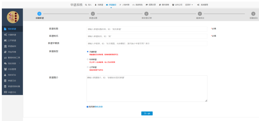
图 4. 新建家谱页面

(2) 如图 5，进入【新建家谱】页面后，填写【家谱名称】、【家谱姓氏】和【家谱字辈表】并点击【下一步】按钮直至家谱创建成功。家谱创建成功后，字辈表也生成成功：