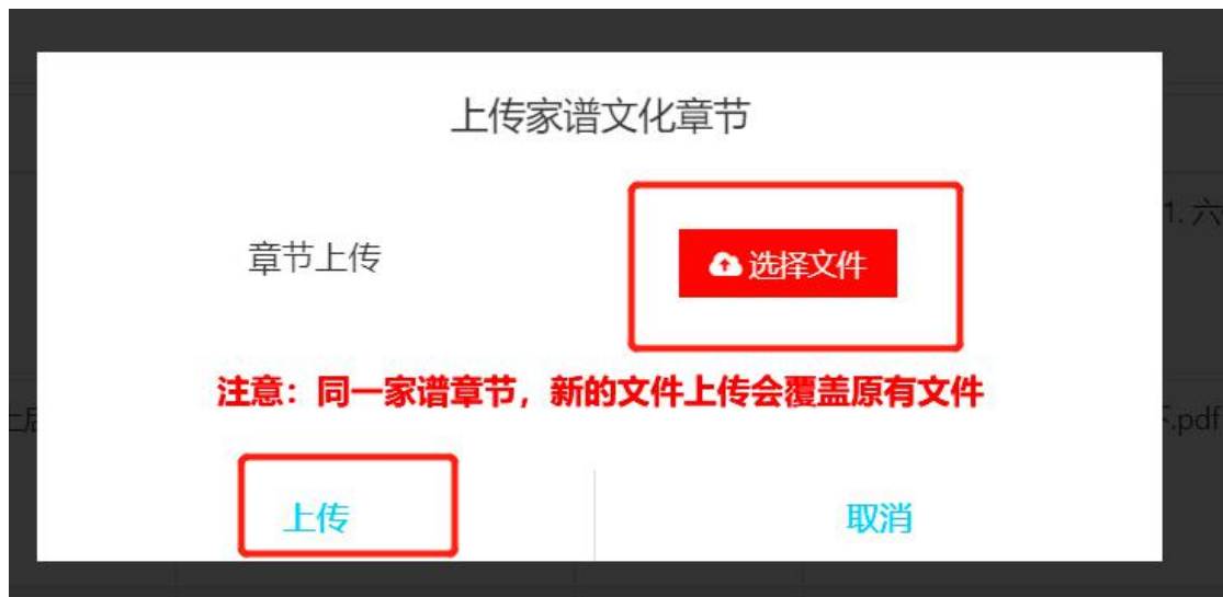
图 14 上传文件界面