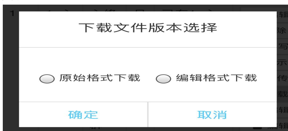
图 16 下载文件格式

下载已上传文件有两种格式选择 1) 原始格式下载: Word 格式 2) 编辑格式下载: PDF 格式, 如图 16。