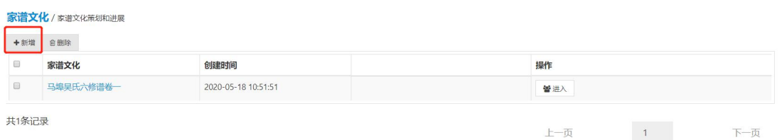
图 2 新增家谱文化

用户进入家谱文化界面以后，有权限的用户（暂只对家谱创建人开放）点击新增，即可创建属于自己的家谱文化，如图 2 所示。