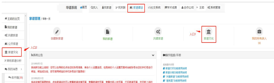
图 1 家谱文化入口

用户点击导航栏中的“家谱建设”链接，在该界面上有两种入口可进入家谱文化，两种入口如图 1 标识所示，任意点击界面中某个“家谱文化”按钮，即可跳转至“家谱文化”页面。用户可通过上述操作进入家谱文化。