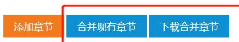
图 17 合并章节入口

用户选择最下方的“合并现有章节”按钮, 将各章节内容进行整合, 并通过“下载合并章节”按钮, 打印合并各章节后的内容, 见图17。