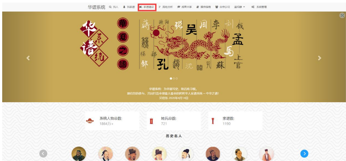
图 2. 华谱系统首页