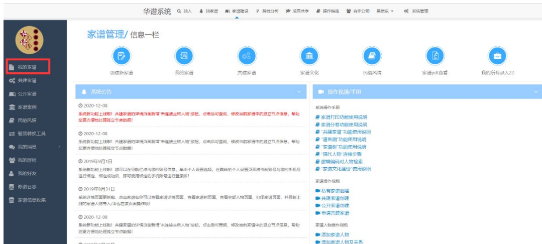
图 3. 家谱建设模块

3) 如图4, 进入到我的家谱界面后, 找到对应的家谱, 点击其后的【 碟记式导出 】按钮: