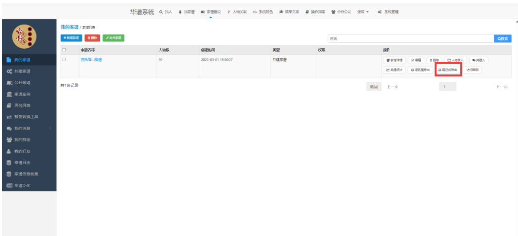
图 4. 我的家谱模块

3) 如图4, 进入到我的家谱界面后, 找到对应的家谱, 点击其后的【 碟记式导出 】按钮: